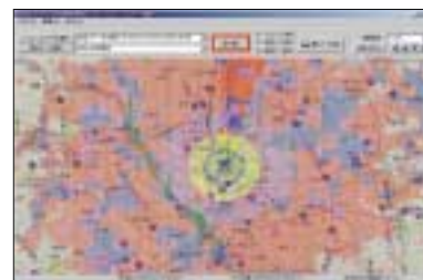
シミュレーション補正

シミュレーション結果に、フィールドでの実測データを反映させて、地図上に表示します。