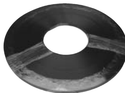
コイル Single layer coil