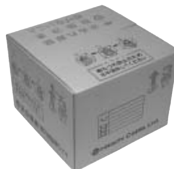
パック Pail pack