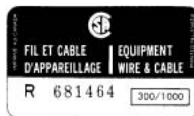
Sticked on tag